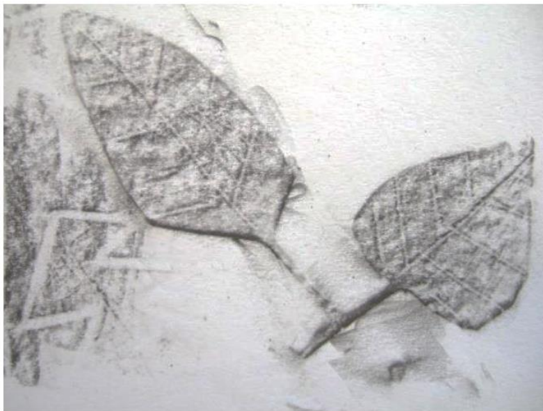
Slika 17: Clive Hicks-Jenkins: Jesen , frotaž, 23,6 × 22,7 cm, 2014.