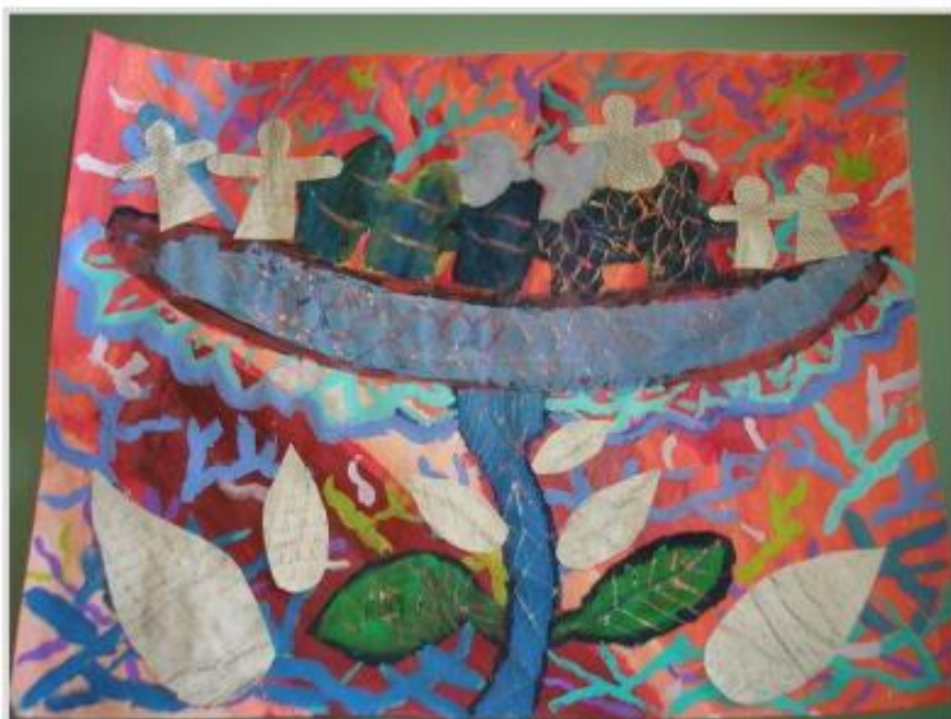
Slika 15: Gajič: Brez naslova , frotaž in lepljenka, 29,7 × 42 cm, 2009.